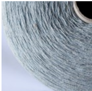
02-041 Bomuld 100% re-cycling Lysblå