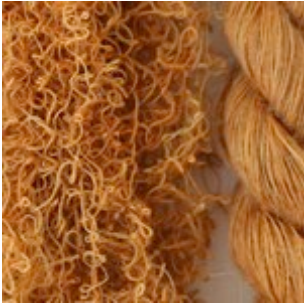
01-020-03 Z Uldcrepe Karry