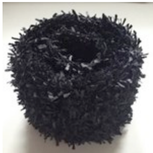
62-010-02 Papir Chenille Sort B