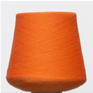
01-020-21 S Uldcrepe Orange