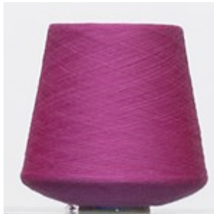
01-020-24 S Uldcrepe Lilla