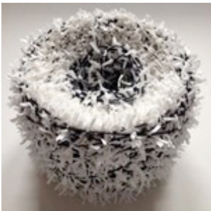
62-010-01 Papir Chenille Hvid B

Vi har fået omspolet det nye Papir Chenille garn til mindre oplægninger. Krydsnøglerne på 50 g er nu tilgængelige i webshoppen. Dette gælder både 62-010-01 Papir Chenille Hvid og 62-010-02 Papir Chenille Sort.