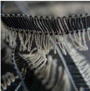
27-001-12 Bomuld/Polyester Bånd

Garnkortet 2018 er sendt ud og vi håber, at I vil lade jer inspirere. Som altid hører vi meget gerne, hvis der er særlige ønsker til næste års nye garner. Bestyrelsen vil gerne sige tusind tak til de flittige hænder, der hjalp os med at sætte de nye garner på kort. Garndagen er fyldt med god inspirerende snak hen over bordet og udveksling af ideer. Tak til Væveværkstedet i Smallegade, Frederiksberg for at stille deres værksted til rådighed.