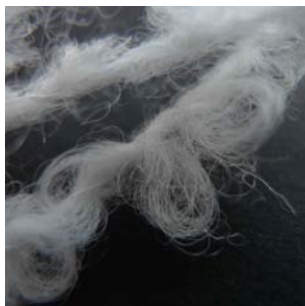
17-001-00 Uld Alpaka Ecrú