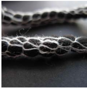
72-001-12 Polyester Tubegarn