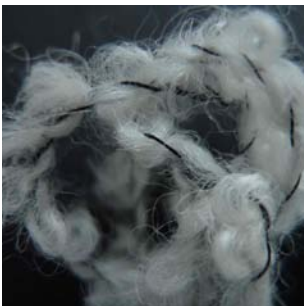
17-001-10 Uld Alpaka Sort/ Ecrú