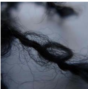
17-001-02 Uld Alpaka Sort