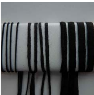
02-003-02 Bomuld 3mm Sort